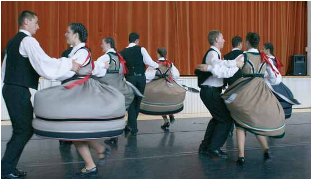
Unkarilaisen Borokan kansantanssit olivat visuaalisesti näyttäviä. Ryhmä esiintyi kurinalaisesti ja säestävä yhte hoiti tyylikkästä osuutensa.