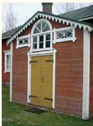
Tervolan kotiseutumuseo avoinna 30.8. saakka ti-pe klo 12-16. Katso myös www.tervola.fi/museo