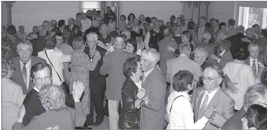
Eläkeliiton juhlissa on aina iloinen ja rento tunnelma. Tervolan kesäjuhlien päätteeksi pistettiin jalalla koreasti.

Aineisto: Tiedotustoimisto Viestintäneuvos Heikkiläntie 12, 94400 Keminmaa, mervi.hopia-jaakkola@pp.inet.fi Toimitus ei vastaa pyytämättä tai tilaamatta toimitetusta aineistosta. Palstamillimetri 0,70 euroa = 70 snt Järjestöilmoitukset 45 snt/pmm Seuraavaan lehteen tulevan aineiston on oltava toimituksessa (kts. aineisto) ilmestymispäivää edeltävän viikon keskiviikkona.