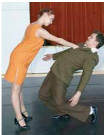
Rimppeämmin Kesäillan valssissa oli runsain mitoin nostalgaa ja huumoria.

Tervolan helteisen kesäillan ohjelmassa oli monipuolisesti Rimppeämmin herkkupaloja aivan yhteen alkuajoina asti. Esimerkiksi Kesäillan valssi hauskoine juonteineen, Kiestingin katrilli ja päätösnumerona esitetty Laatokan tuulia palkittiin raikuvien aplodein. (JJ)