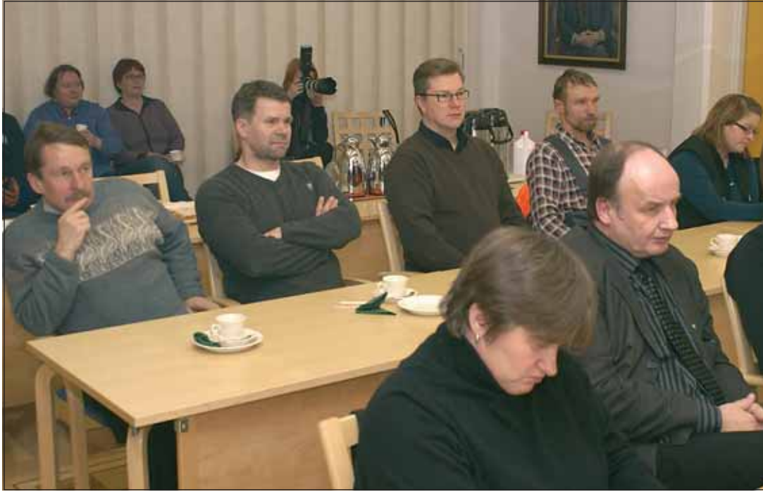
Illan teemat kiinnostivat osallistujia. Keskusteluunkin oli varattu aikaa, mutta rupattelu jäi pariin puheenvuoroon.