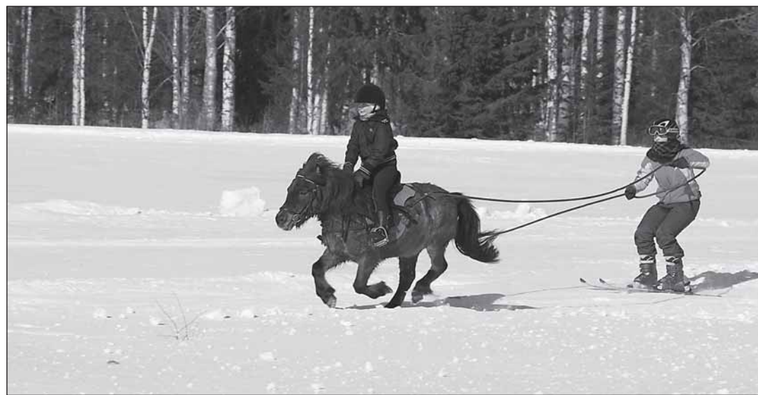
Talvitapahtumassa riittää menoa ja meininkiä. Tervolan ratsastajat ovat lupautuneet esittelemään vauhdikasta hiihtoratsastusta.

Tervolan työttömyysaste marras- kuun päättyessä oli 14,8 %. Työt- tömien määrä on kurkkipitäjässä kasvanut vuodessa 29,7 prosent- tia. Meri-Lapin kunnissa on tätä- kin rumempia lukuja: esimerkiksi Kemi (16,6 %, lisäys 34 %) ja Tor- nio 13,7 %, lisäys 31,4 %).