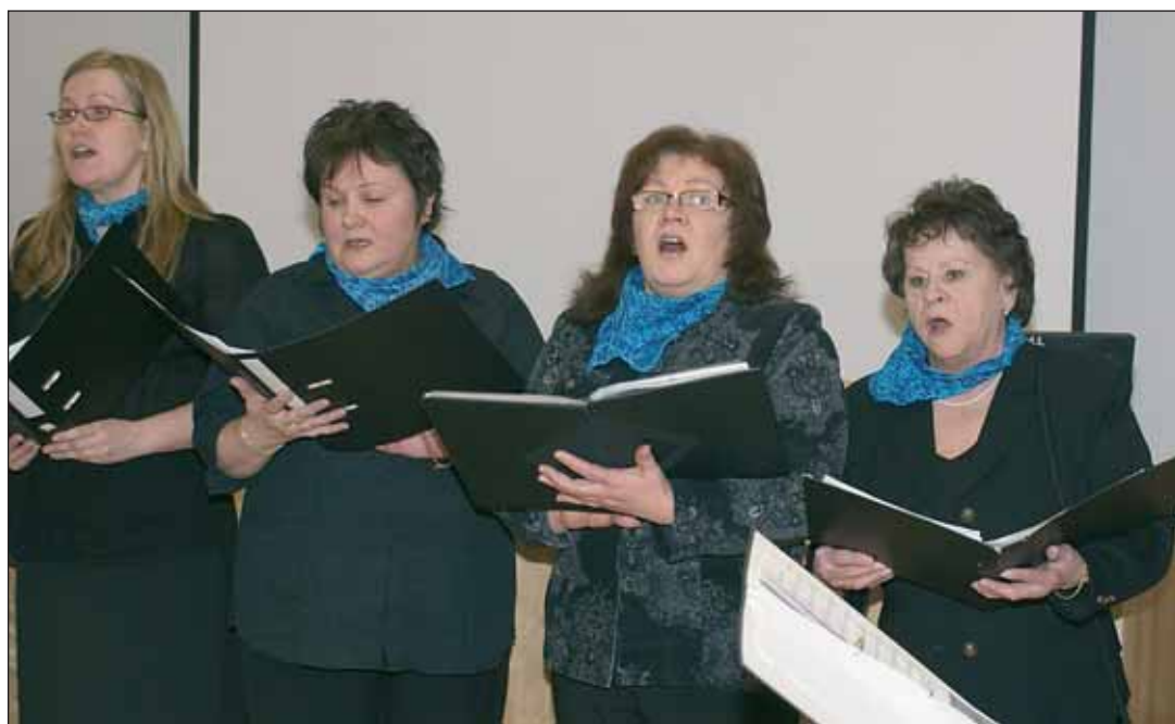
Kehittämissiltaman tunnelman vapauttajana ja elävöittäjänä toimi terhakka lauluryhmä Töpäkät.

- Tietysti tämä aika tuo pakko- yrittäjyyttäkin mukaan kuvioihin. Monet ovat tulleet meille suoraan yritysmaailmasta, Nurmos sanoi. (JJ)