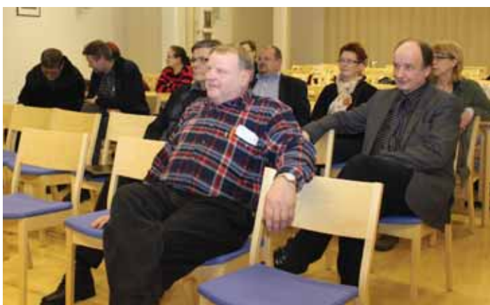
Työpajaan osallistuneiden runsas määrä oli pienoinen yllätys järjestäjille. Asia koettiin omiksi ja tärkeiksi.

Iltapäivällä sitten pohdittiin keinoja tavoitetilojen saavuttamiseksi. Osa ongelmista ei ole kuitenkaan osallistujien ratkaistavissa; näitä ovat mm. tiehallinnon päätökset opastetornien toteuttamisessa.