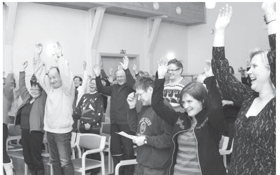
Luontoilta aloitettiin railakkaasti naurujoogan hausalla tempolla.

On Hyttisellä ollut totuttelemissa Lapin elämänmenoon. Lapin taivaan värikkäistä haltioituneita Hyttinen tietää, että paikallisessa kaupassa puhutaan pitkät tovit - ei