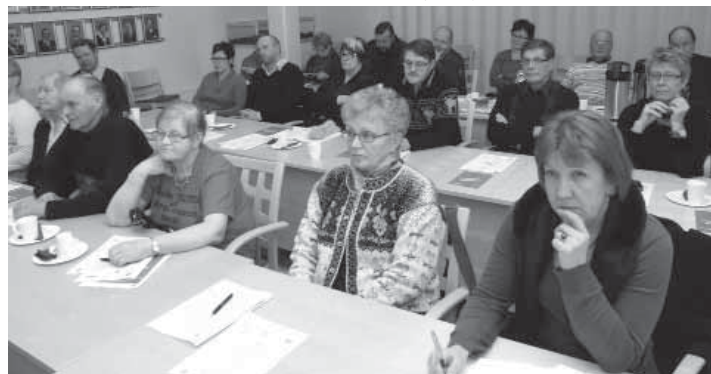
Tervolan kylien ilta kokosi ilahduttavan runsaasti ihmisiä keskustelemaan ja saamaan ajankohtaista tietoa.