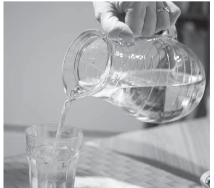
Laadukas talousvesi on hyvinvoinnin edellytys.

Kullakin vedenottoalueella on yksi kuilukaivo. Mainituista vain Kauvonkankaan ottamon vesi desinfioidaan UV-laitteistolla ennen kulutukseen johtamista. Muilla ottamoilla ei ole varauduttu desinfiointiin. Kaikkien ottamoiden vesi on jo sellaisenaan - ilman käsittelyäkin - hyvää talousvettä.