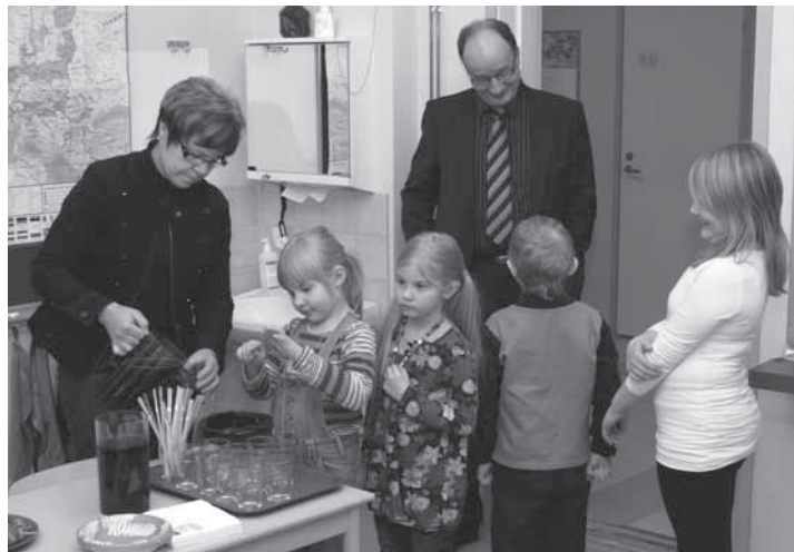
Kerholaisten juhlailla huipentui ”kokkareihin”, joiden erikoisuutena olivat itse leivotut herkkukeksit.