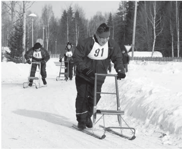
Potkukelkkakissassa on aina suuren urheilujuhlan tuntua.

TTTT-tapahtuman avauspäivänä 8.2. lapsille tarjotaan kirjastossa nukketeatteriesitys Saapasjalkakissa. Torstaina musiikin ystäviä hemmotellaan Länsi-Pohjan jousikvarterin konsertilla. Muusikot soitta-