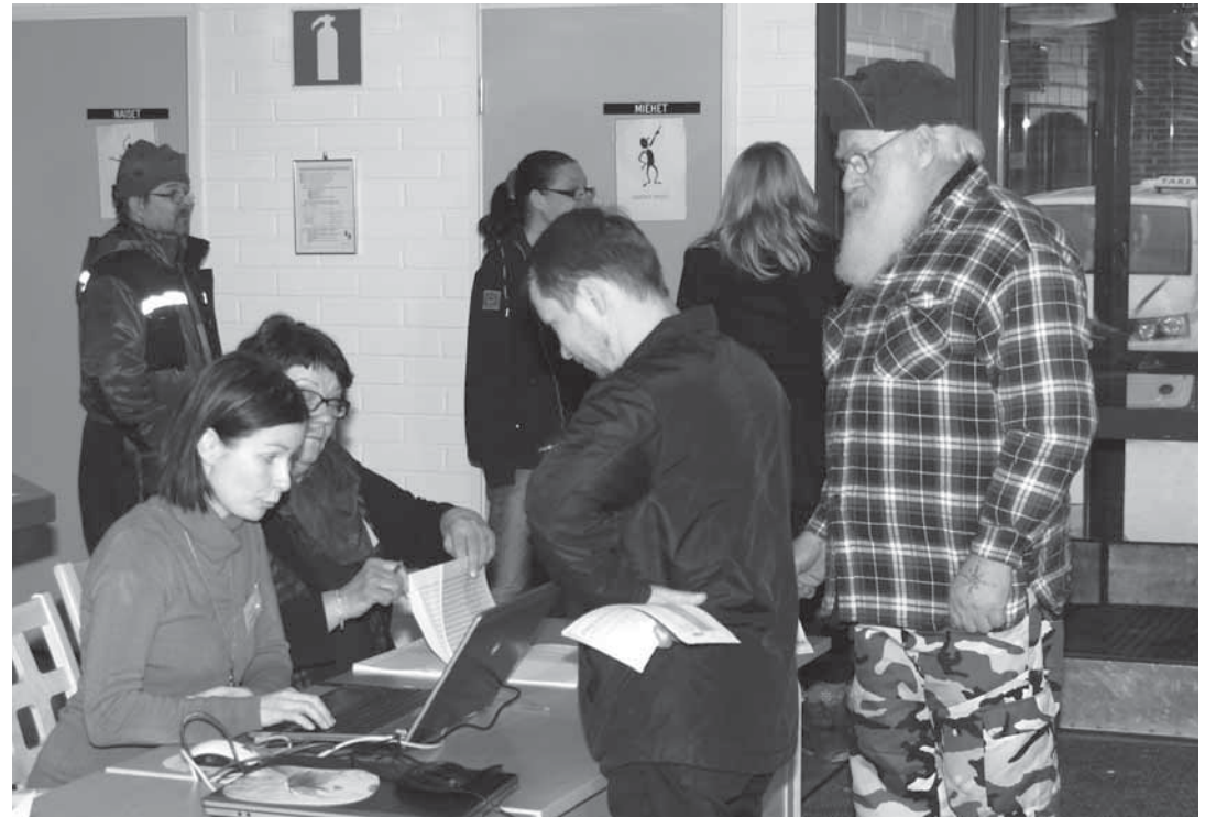
Tammikuun vaalipäivänä Tervolan äänestyspaikalla oli vilskettä.

- Kyllä tämä presidentti-instituutio tärkeä on; ei sitä pidä vähätellä. Kun muistellaan vanhoja aikoja, mieleen tulee presidentti Risto Ryti . Hän oli mies, joka pelasti