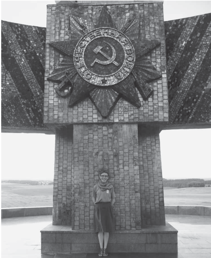
Kirjoittaja historiallisella paikalla.