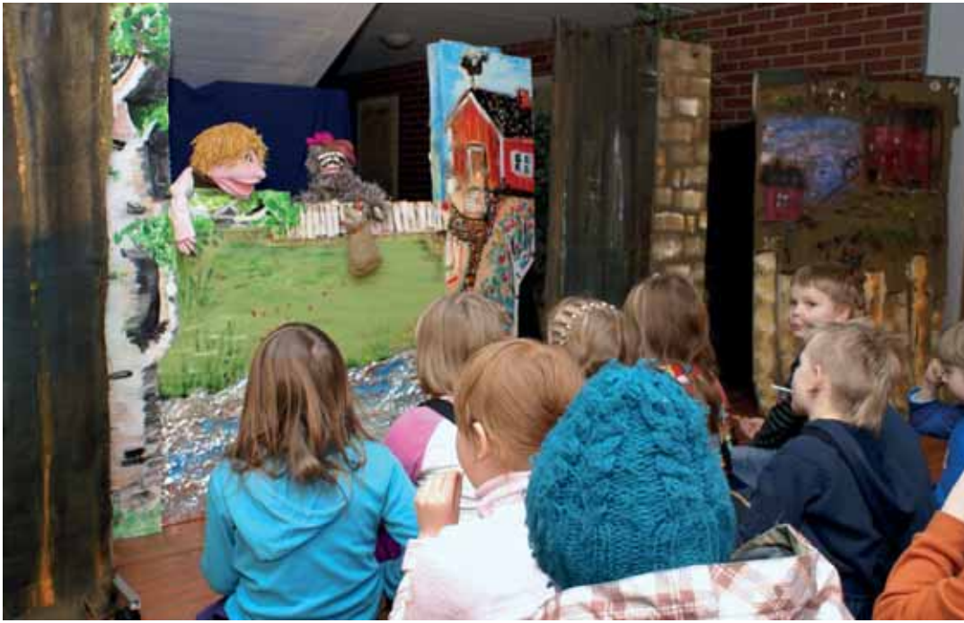
Saapasjalkakissa veti kirjaston näyttämön hetkessä täyteen satunälkäisiä katselijoita.