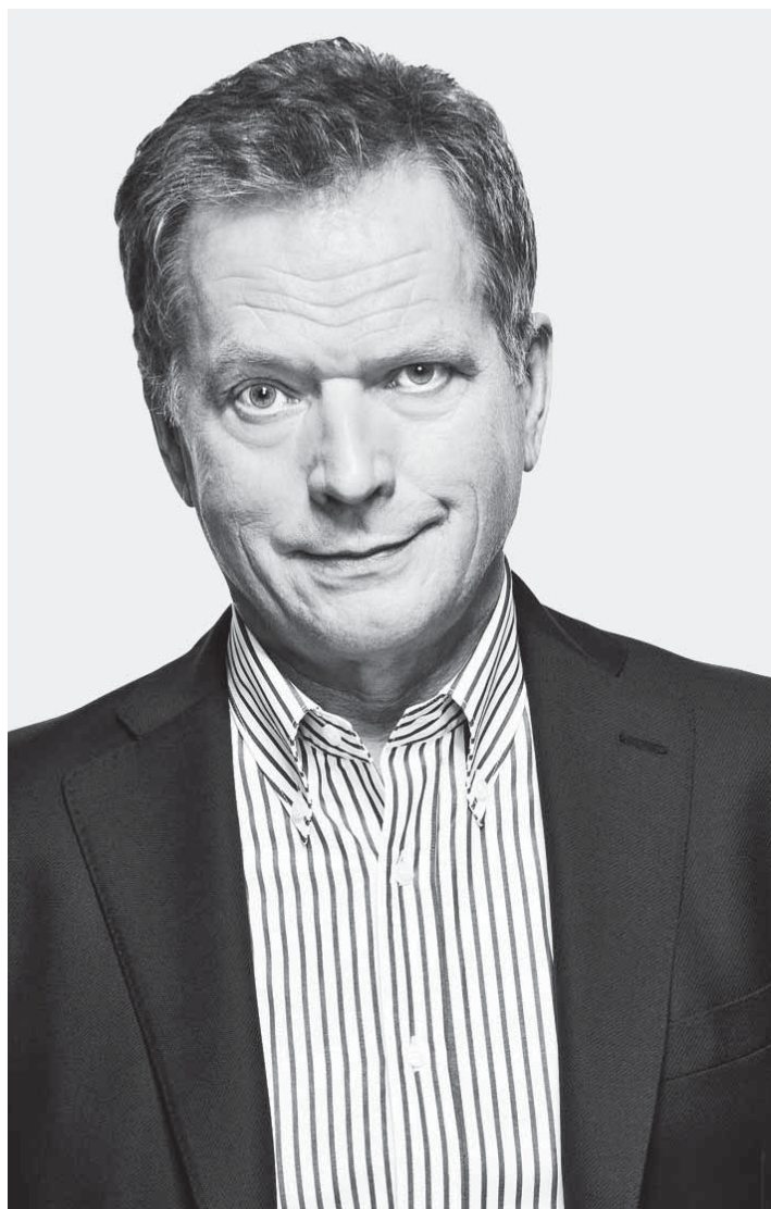
Uusi presidenttimme Sauli Niinistö vieraili Tervolassa vaalikiertueensa alkutaipaleella runsaat kaksi kuukautta sitten.

Maaliskuussa virallisesti presidenttinämme aloittava Sauli Niinistö käväisi pikaisella Tervolan visiitillä viime itsenäisyyspäivän jälkeisenä päivänä. Hän tutustui Paakkola Conveyors Oy:n tehtaaseen ja ehti hetken porista tervolalaisten kanssa firman avointen ovien päivän tilaisuudessa.