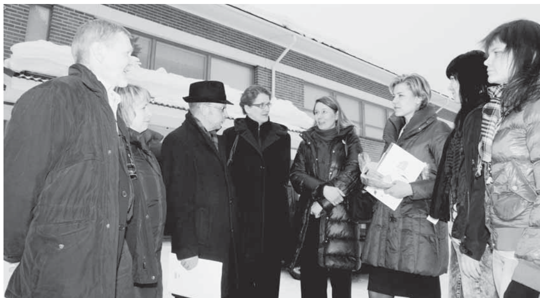
Tervolassa viime keväänä vieraillut hallinto- ja kuntaministeri (silloinen opetusministeri) Henna Virkkunen (kok.) joutuu nyt tosi rajun myrskyn silmään.