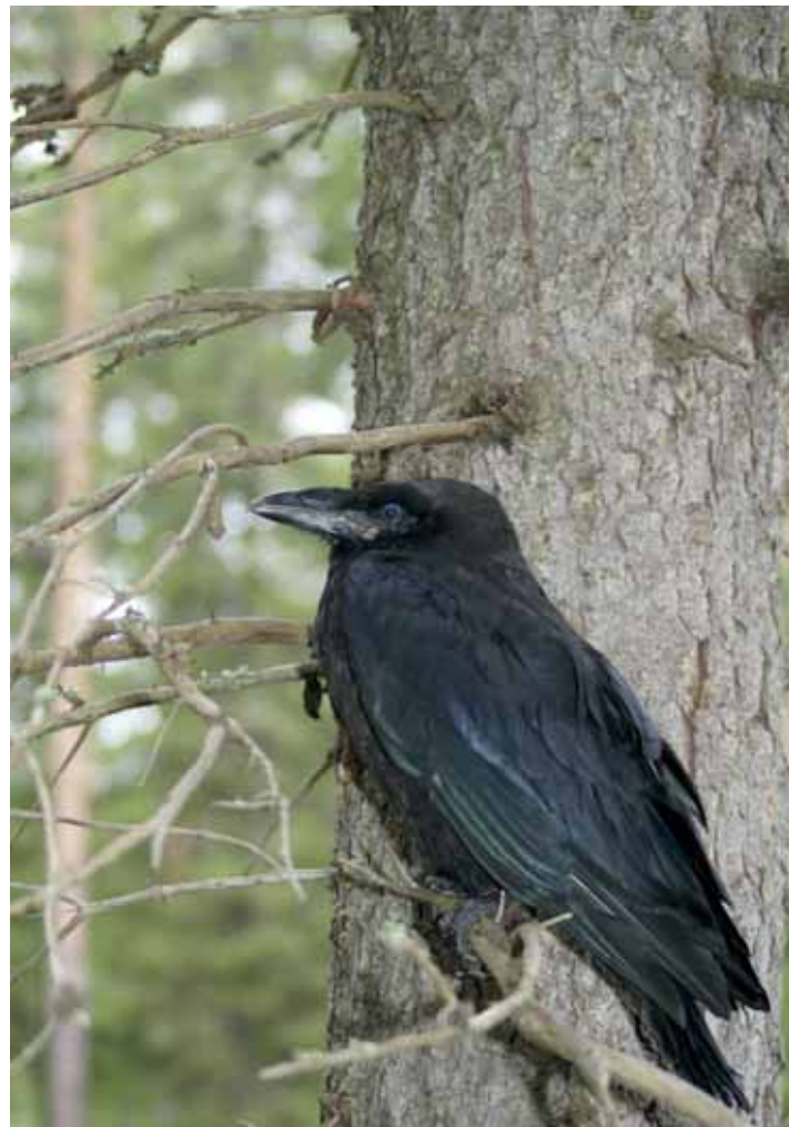
Vaeluksella voi yhyttää korpin – tosin harvemmin näin läheltä.

Tiedustelut ja ehdotukset: Petri Törmänen, Vaarojen vaellus -hanke, puh. 040 151 9757, petri.tormanen@tervola.fi