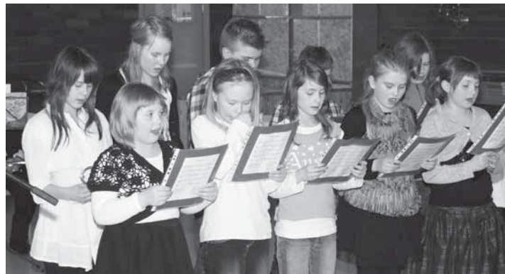
Mattisen koulun oppilaat lauloivat juhlaan harrasta tunnelmaa.

Tervolan veteraanijuhlissa oli mukana muutama veteraani; joukot harvenevat vuosi vuodelta. Yksi