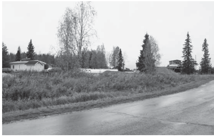
Hastinkankaan teollisuusalue on Nelostien kupeessa ja rajoittuu pohjoisessa tähän Varejoelle johtavaan tiehen.

Kilpailuun on nimetty tuomaristo, joka palkitsee kilpailun toisen vaiheen jälkeen kaksi parasta ehdotusta. Ensimmäisen palkinnon suu-