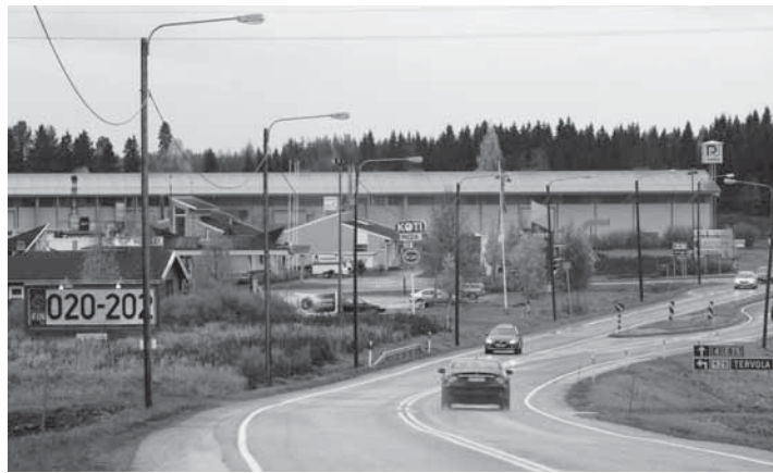
Teräspuistoa hallitsee Paakkola Conveyors Oy:n massiivinen tehdas, joka erottuu taustalla.