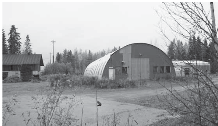
Aseman teollisuushallin kello on kohta lyöntinsä löyry. Aikansa luomus on nyt kunnan myyntilistalla.

- Olisi ollut hyvä mennä siinä marssijärjestyksessä, johon Tervolassa on yhteistuumin totuttu ja sitouduttu. Valmistelu on nyt ollut liian nopeaa. Peräänkuulutan tässä rauhallista ja harkitsevaa asioiden hoitoa, Keränen kiteytti.