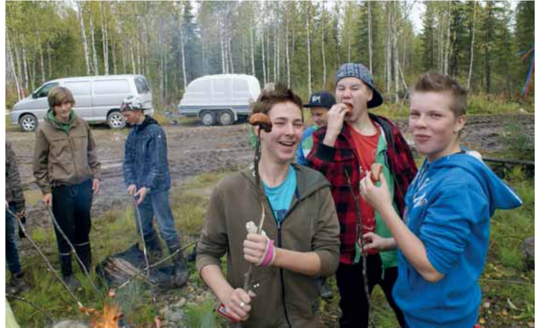
Makkara maistui reippaille metsäretkeläisille. Päivän mittaan opittiin paljon uutta ja nautittiin luonnosta.

Monet metsään heitetyt roinat, kuten pullot, tölkit, muovit ynnä muut paitsi rumentavat näkymiä myös säilyvät luonnossa pitkään ja