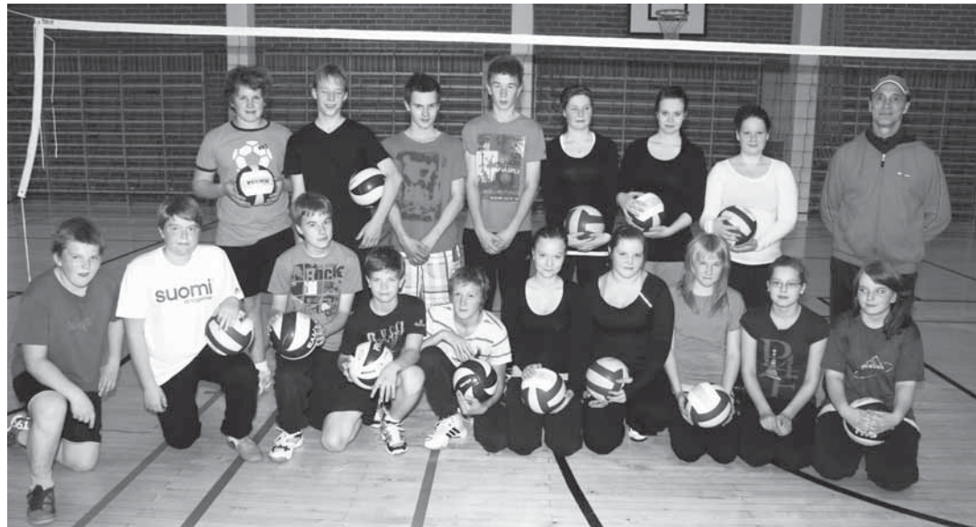
Eipä taida monesta pitäjästä löytyä lentopalloilun pariin näin isoa nuorten tulokasjoukkoa!

- Nyt on tavallista mukavampi toivottaa kaikille hyvää syksyä ja kutsua teidät seuraamaan vauhdikasta ja taitoja kartuttavaa lentopalloilua. * (JJ)