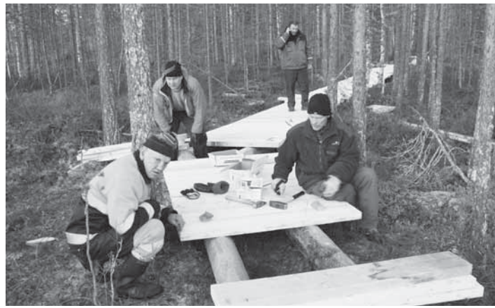
Esteetön Kätkä-hanke on tarjonnut rakentajilleen sopivasti haastetta.