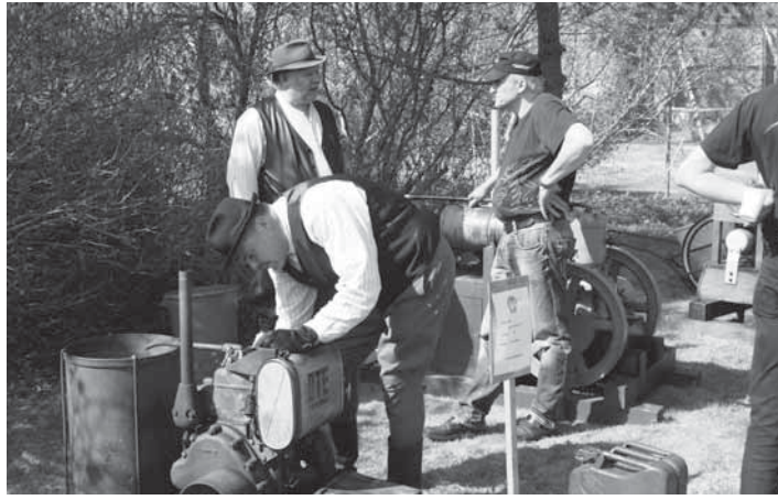
Vanhat koneet ovat olleet Paakkolan kevätsiemennyksen vetonauloina alusta lähtien.