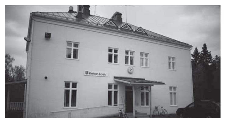
Koivun koulu on komea näyte 20-luvun kouluarkkitehtuurista ja rakentajien taidoista.