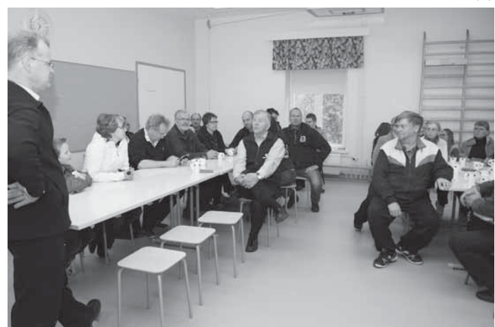
Nopea laajakaista veti Koivun kouluun ilahduttavan runsaasti väkeä.