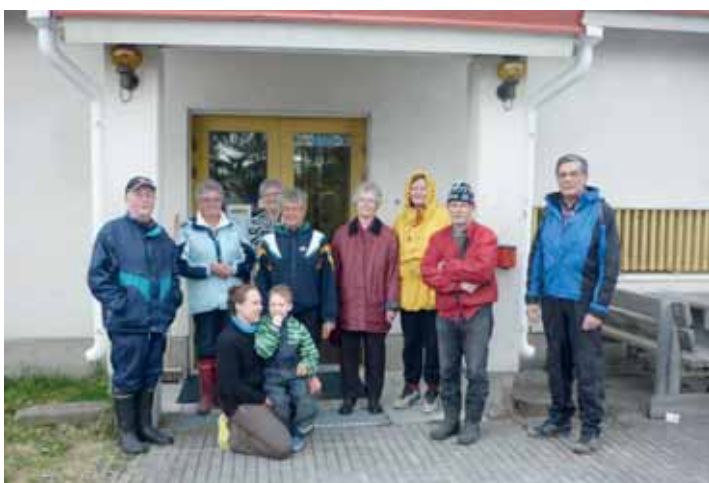
Siivoustalkoisiin osallistui kymmenkunta kyläläistä.