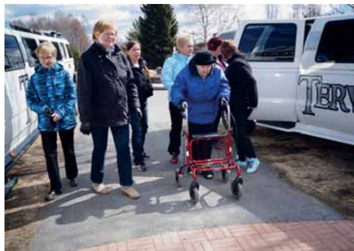
Virkistyspäivään ladattu hemmottelu alkoi tyylikkäästi - limusiinikyödyillä kotiovelta Tervolahoviin.