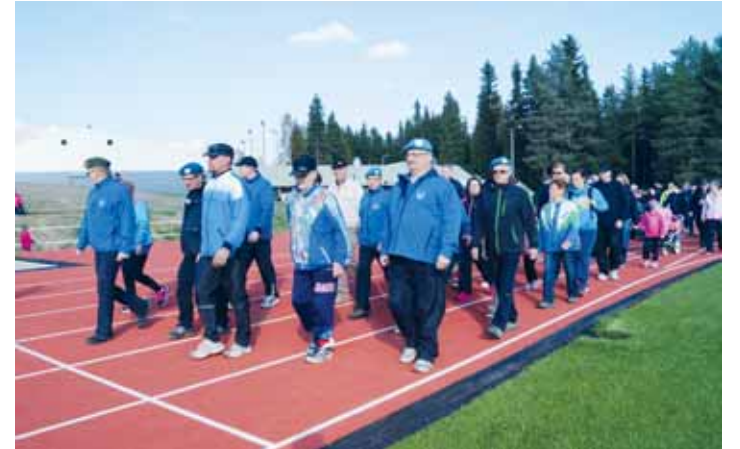
Veteraanikävely sai kaikenikäiset kuntalaiset liikkeelle.

kennettiin 32 vuotta sitten, joten se ei enää täyttänyt tämän päivän vaatimuksia. Nyt uudistetulla kentällä on Novotan M-pintainen, 400 metrin juoksurata, jolla on tarjolla 6/4 rataa. Lisäksi kaikki suorituspaiikat on uusittu ja katsomoa parannettu.