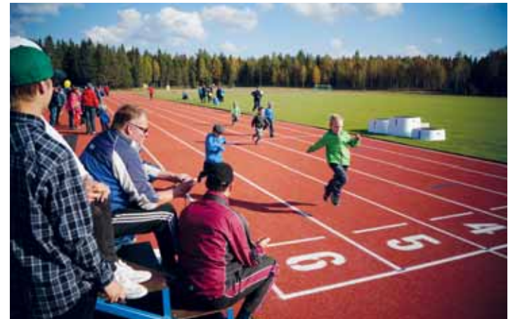
Juoksuradan äärellä saatiin viitteitä tulevista sprinttereistä.