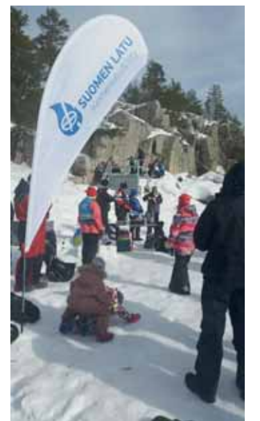
Perinteinen Vammavaaran ulkoilutapahtuma sai Marianpäivänä jatkoa muutaman vuoden tauon jälkeen.