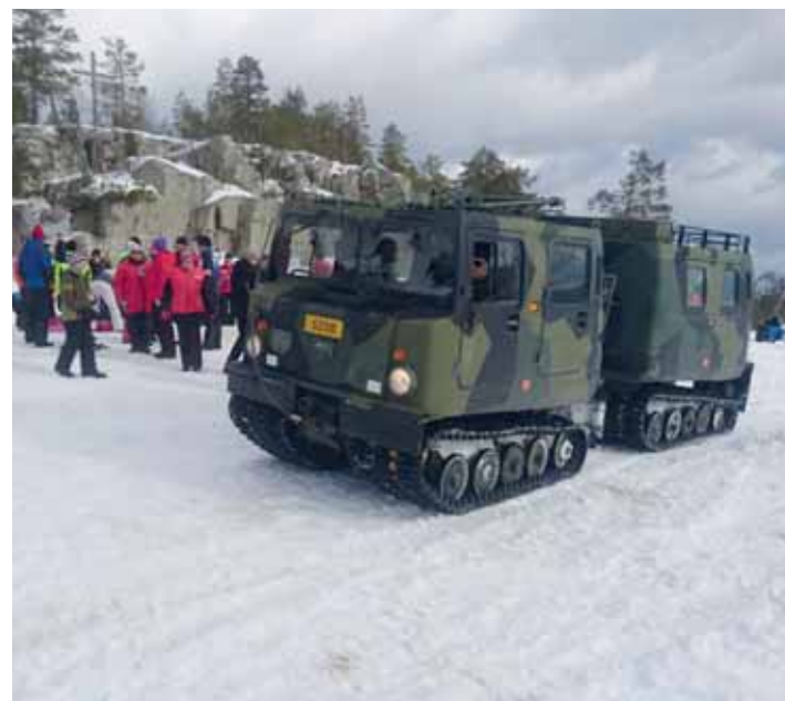
Ikäkkäimmät osallistujat ja lapsiperheetkin pääsivät vaaraan laelle tela-ajoneuvon kyydissä.