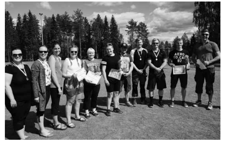
Ämpärinheiton naisten- ja miesten sarjoissa oli kovia heittäjiä.

Tervolan Ulkoilijat järjestävät elokuussa maastopyöräilytapahtuman, jossa meitä tervolalaisia lajiin harrastajia on myös mukana. Toivottavasti saamme silloin isettyä lisää kipinää varsinkin nuoriin pyöräilijöihin, jotta he innostuisivat maastopyöräilystä seuratoiminnan puitteissa. Maastopyöräily on