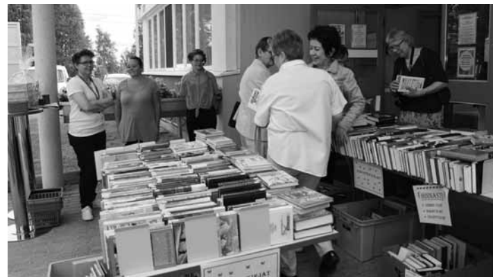
Kirjaston poistomyynnissä riitti asiakkaita.