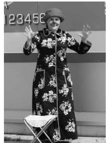
Viikinkiprinsessa veti kansaa puoleensa vuorovaikutteisessa katuteatterissa.