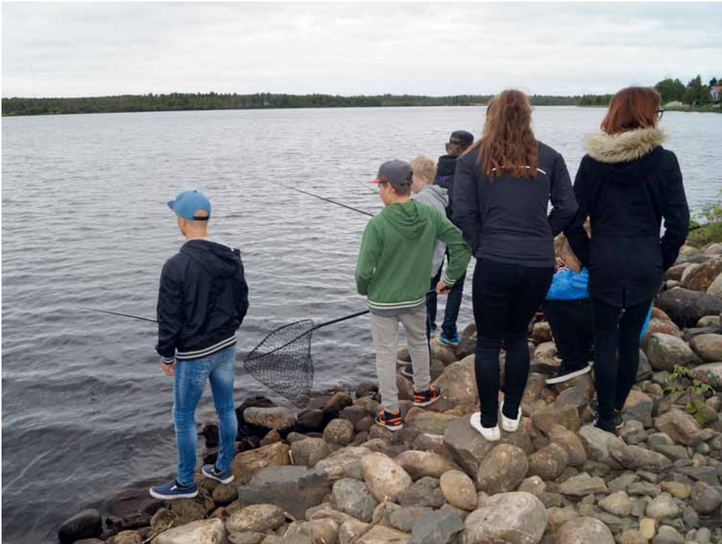
Kalastus on suosittu harrastus Kemijoen äärellä asuville tervolalaisille.