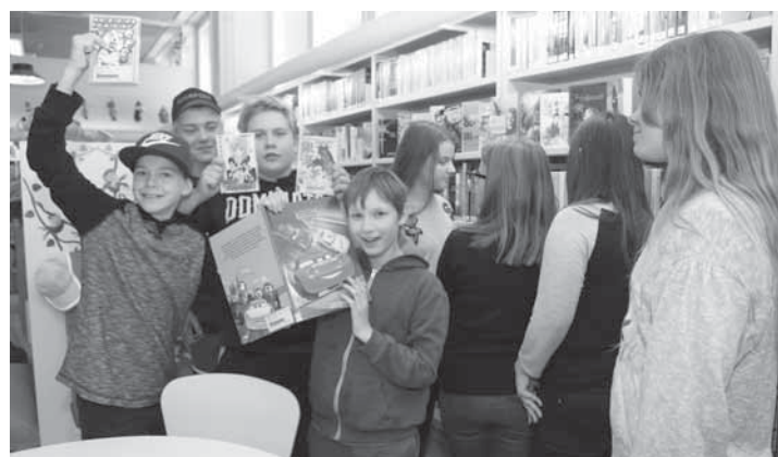
Yläkoulun oppilaat kansoittivat kirjaston koulutuntien päätyttyä. – Tätä päivää on odotettu, he riemuksivat.