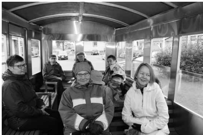
Kaupunkijunan kyyti oli harvinaista herkkua asuinpalveluiden asukkaille ja henkilöstölle.

Seniorikuntosaliryhmät aloittavat! Senioreille tarkoitettavat kuntosaliryhmät kokoontuvat tiistaista 12.9. alkaen klo 12 ja 13.15. Tervetuloa!