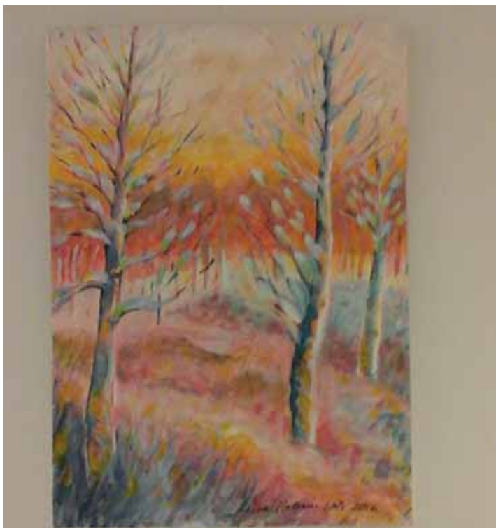
Talvi ei ole pelkkää mustavalkoista; utelias kulkija löytää muitakin värejä.

Toissa Värikäs talvi, Tielle päin, Usvaa ja Kevään tuntu, näkyy talven erilaisia ilmeitä. Näyttely saikin nimekseen: Talvi taittuu. Tauluihin voi tutustua Pihakullerossa helmi-kuun loppuun asti. *