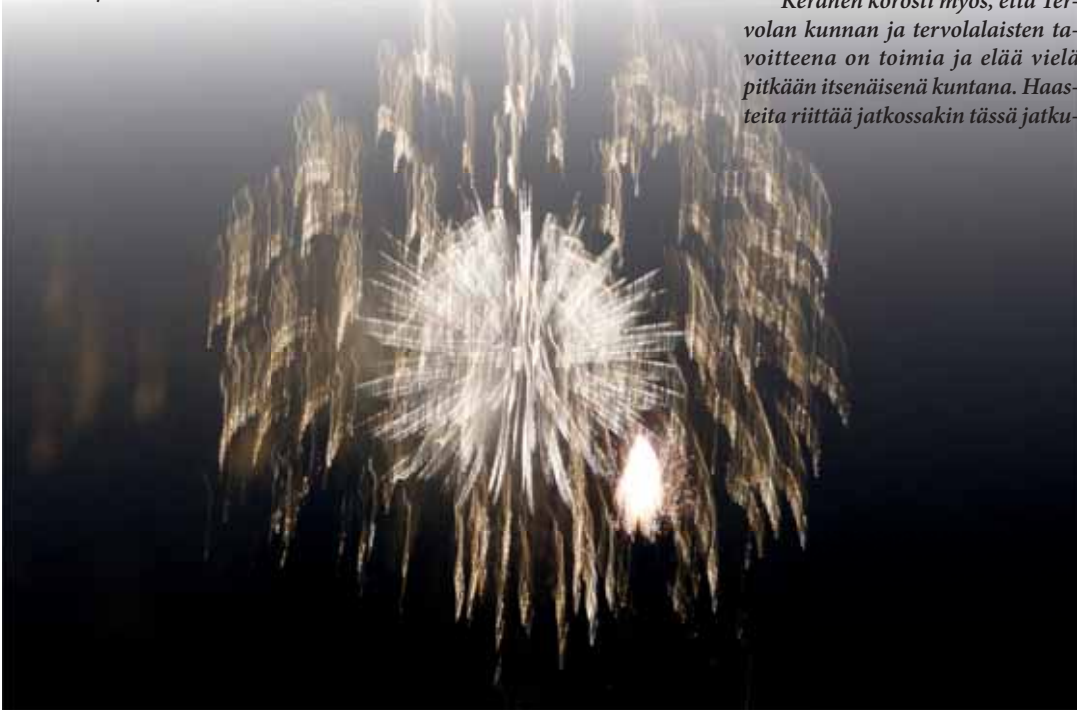
Juhlavuoden avaus huipentui näyttävään ilotulitukseen, joka sai sadat katselijat iloiselle juhlamielelle.