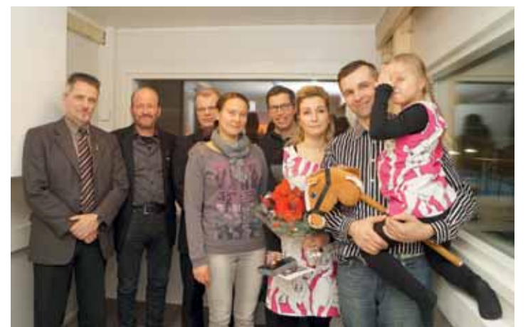
Maaseutuyrittäjäpalkintoa oli jakamassa arvovaltainen vierasjoukko kunnanjohtajista lähtien.