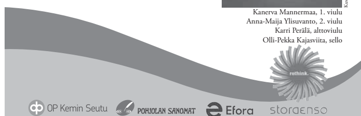
Kanerva Mannerman, 1. viulu Anna-Majaja Ylisuanto, 2. viulu Katri Perälä, alttoviulu Olli-Pekka Kajasviita, sello