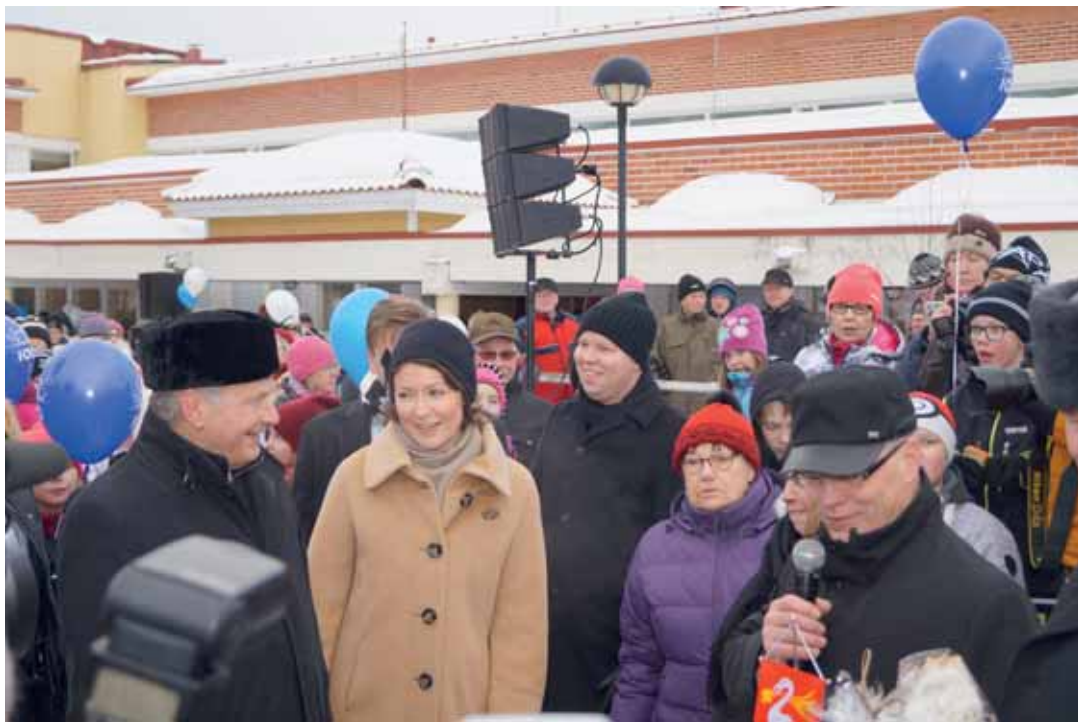
Presidenttipari oli melkoisessa pyöräryksessä tervolalaisten parissa Lapinniemen koulukeskuksen pihalla.