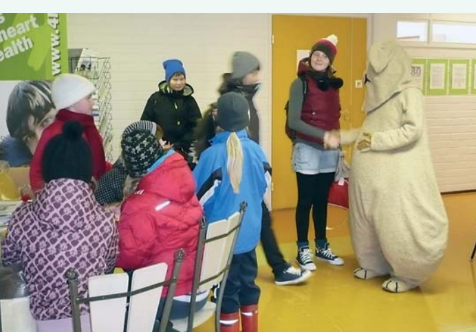
Topi-maskotti viihdytti kävijöitä.